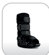
Bota ortopédica cano curto