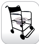
Cadeira de banho até 130 kg