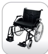
Cadeira de rodas até 160 kg