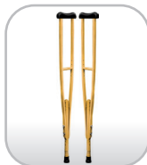
Par de muletas de madeira