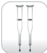
Par de muletas axilar de alumínio