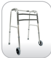
Andador com rodinhas 1