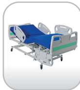
Cama hospitalar automatizada com colchão