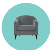
Casa e Decoração