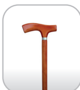
Bengala de madeira

Estamos sempre atualizando os equipamentos para atender melhor nossos clientes. Possuímos procedimentos de higienização e manutenção diária, o que garante a qualidade de nossas locações.