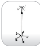
Suporte para soro