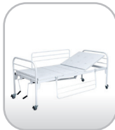
Cama hospitalar manual