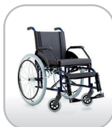
Cadeira de rodas até 120 kg