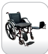
Cadeira de rodas até 100 kg com apoio