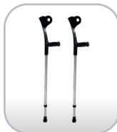
Par de muletas canadense