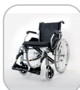
Cadeira de rodas 90 kg / 100 kg