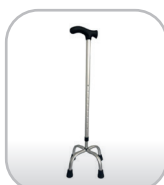
Bengala 4 pontas