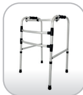
Andador de alumínio