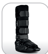
Bota ortopédica cano longo