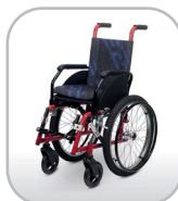
Cadeira de rodas infantil