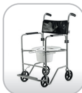
Cadeira de banho até 90 kg